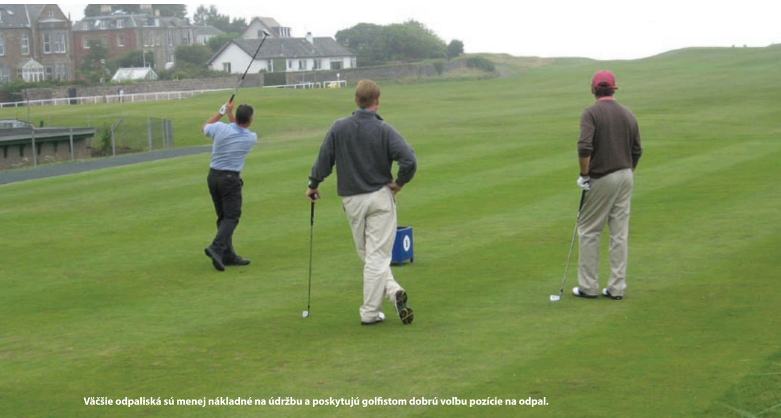
Väčšie odpaliská sú menej nákladné na údržbu a poskytujú golfistom dobrú voľbu pozície na odpal.

ale i na nákladoch. Ak chcete dosiahnuť vyššiu rýchlosť greenov, je potrebné splnenie nasledovných požiadaviek: