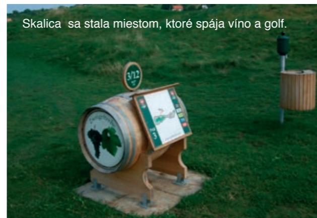
Skalica sa stala miestom, ktoré spája víno a golf.

Ide o ihrisko linkového typu, voľne otvorenú plochu, ktorá sa nachádza na úpätí skalických vinohradov. Ihrisko má veľa pieskových prekážok, len na prvej deviatke ich je 81. Vyžaduje to značné úsilie na ich úpravu. Na jar a na jeseň je častý pomerne silný vietor, v lete je naopak tunajší vánok pre golfistov príjemným ochladzujúcim prvkom. Typické budú vysoké klasovité roughy. Do budúcnosti plánujeme vysadiť pár soliterných stromov a krov, ktoré budú slúžiť aj ako orientačné body v inak otvorenej krajine.