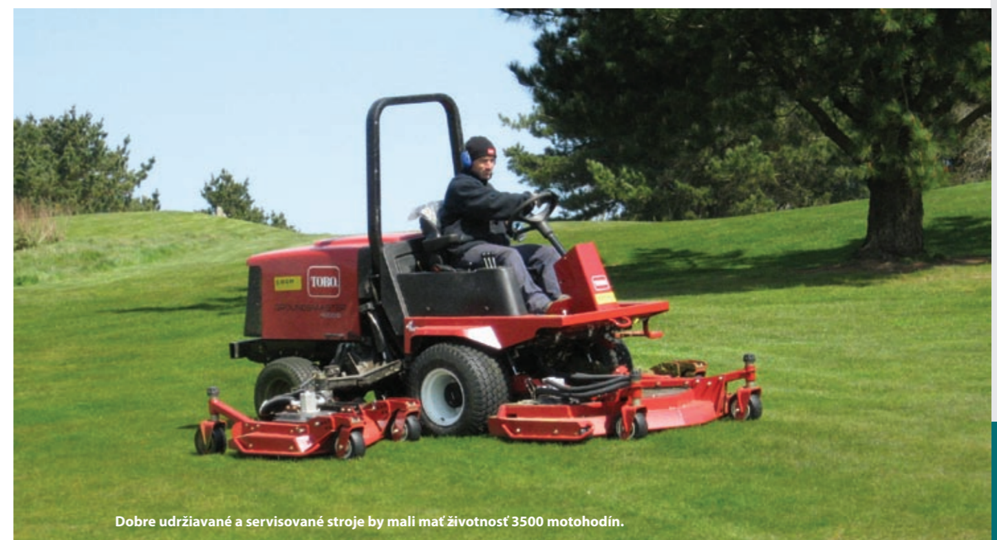
Dobre udržiavané a servisované stroje by mali mať životnosť 3500 motohodín.

Snáď najväčším konfliktom záujmov je v rámci greenov ich rýchlosť. Na tento aspekt sa kládne príliš veľký dôraz, pričom sa zabúda na kvalitu, pevnosť a hladkosť povrchu greenu. Posadnutosť rýchlosťou greenov sa odráža nielen na zdraví trávniku,