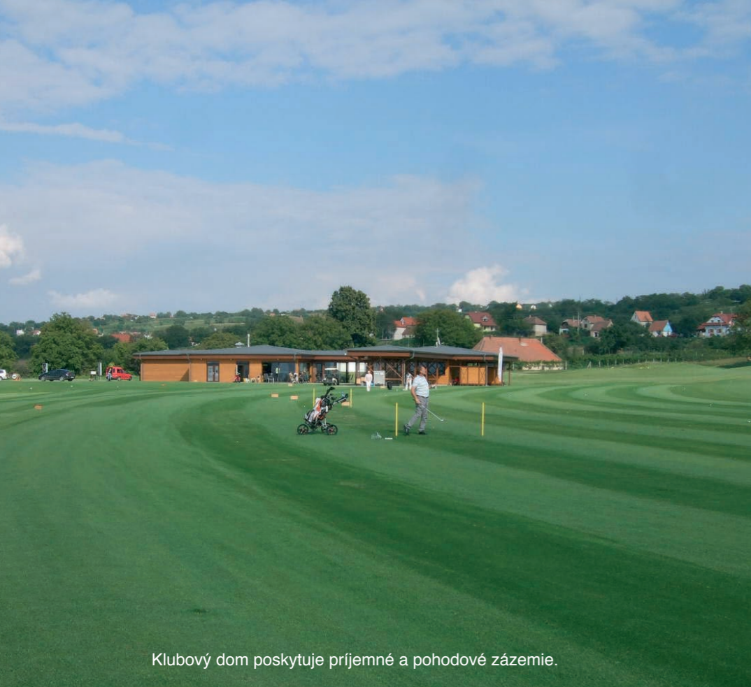
Klubový dom poskytuje príjemné a pohodové zázemie.