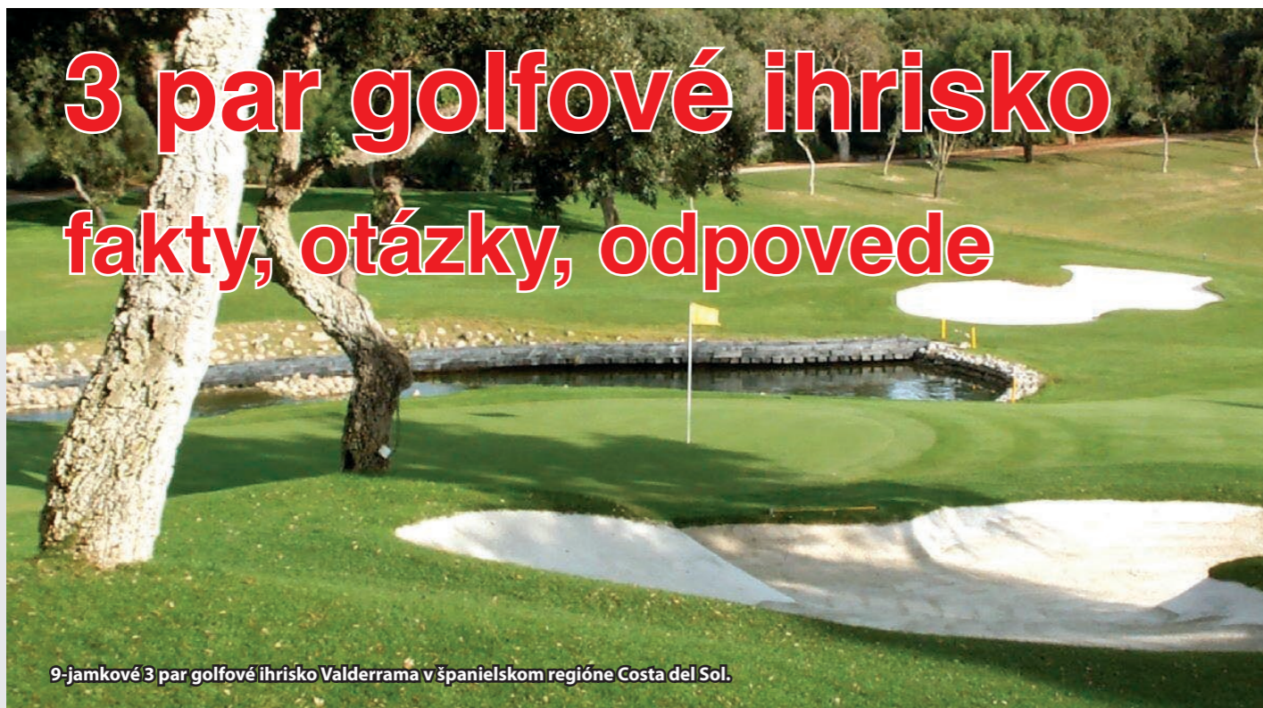
9-jamkové 3 par golfové ihrisko Valderrama v španielskom regióne Costa del Sol.

3 par golfové ihriská sú veľmi obľúbené. Sú vhodné pre začínajúcich golfistov, juniorov, príležitostných hráčov golfu, rodiny, ktoré chcú hrať golf spolu. Vyhovujú ženám, seniorom, ktorí si radi chodia svoju hru precvičovať, tým, ktorí si chcú zahrať rýchle kolo, firemným podujatiam či skúseným golfistom, ktorí si chcú zahrať len krátku hru. Uvažujete o stavbe 3 par golfového ihriska? Tu sú niektoré najčastejšie kladené otázky na spomínanú tému.