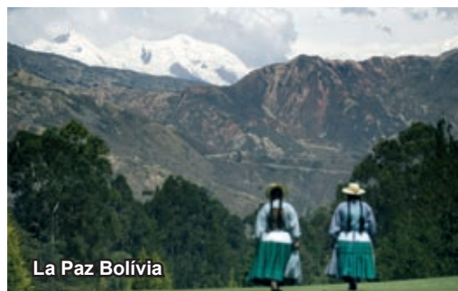
La Paz Bolívia