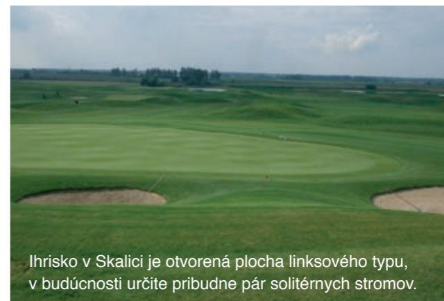
Ihrisko v Skalici je otvorená plocha linkového typu, v budúcnosti určite pribudne pár soliterných stromov.