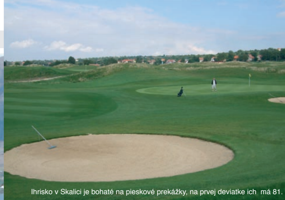
Ihrisko v Skalici je bohaté na pieskové prekážky, na prvej deviatke ich má 81.

Golf v Kanade patril medzi najkrajšie golfové zážitky.