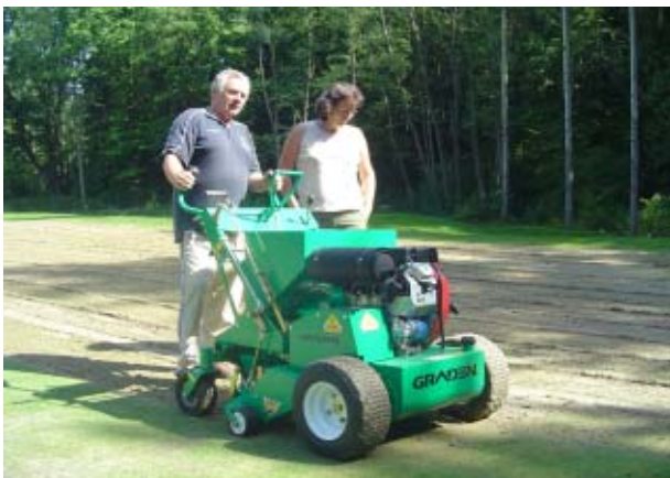
Golfové ihrisko na Dýsine