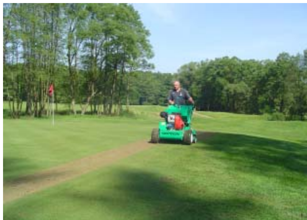
- robila sa len vertikutácia, pretože nemali dostatok piesku.