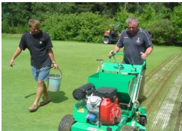
Piesok sa do zásobníka dopĺňa kontinuálne, skracuje sa tým čas potrebný na ošetrovanie trávniku a eliminujú sa prestoje.